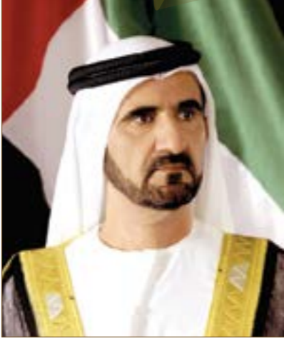
صاحب السمو الشيخ محمد بن راشد آل مكتوم نائب رئيس الدولة، رئيس مجلس الوزراء، حاكم دبي