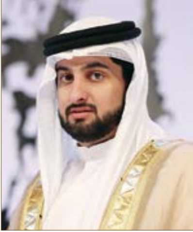
سمو الشيخ أحمد بن محمد بن راشد آل مكتوم رئيس اللجنة الأولمبية الوطنية