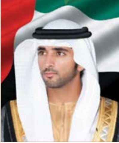
سمو الشيخ حمدان بن محمد بن راشد آل مكتوم ولي عهد دبي، رئيس مجلس دبي الرياضي، راعي الجائزة