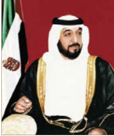
صاحب السمو الشيخ خليفة بن زايد آل نهيان رئيس دولة الإمارات العربية المتحدة